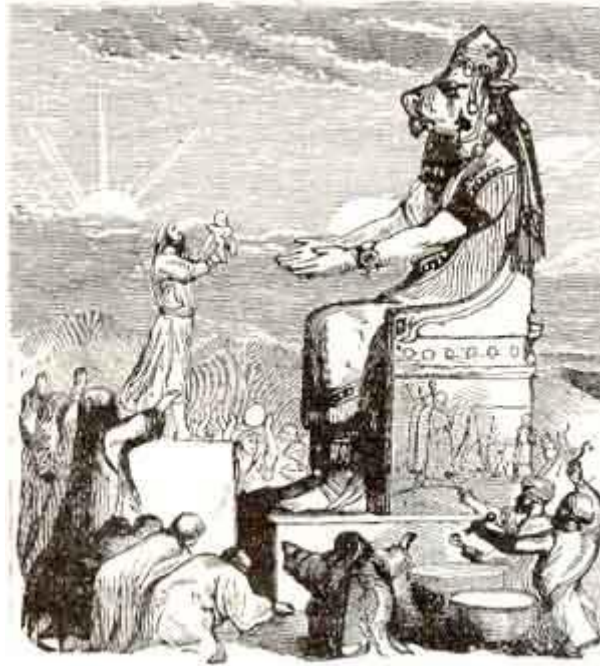
Babylonians sacrificing children to Baal.