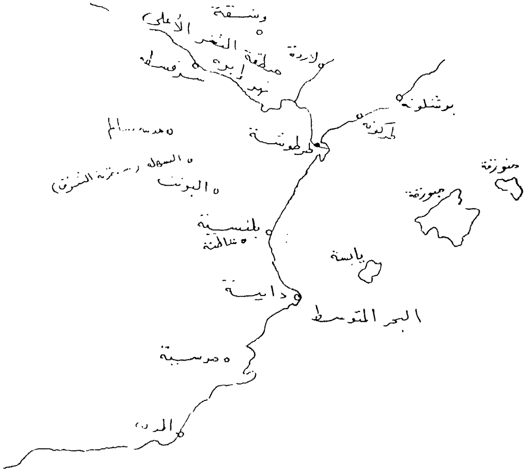
« حريّات شرق وشمال شرق الأندلس » عن: ليفر بروفنسال *