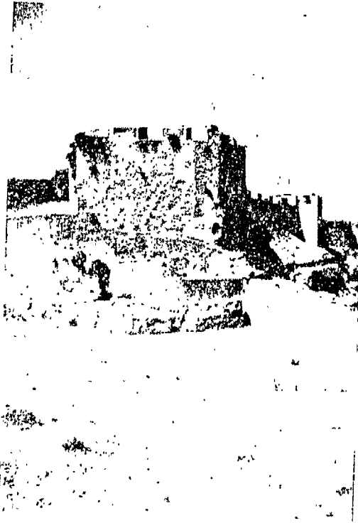
طرطوشة . أطلال القصة الأندلسية عن د عطف ب الآثار الأندلسية المانية